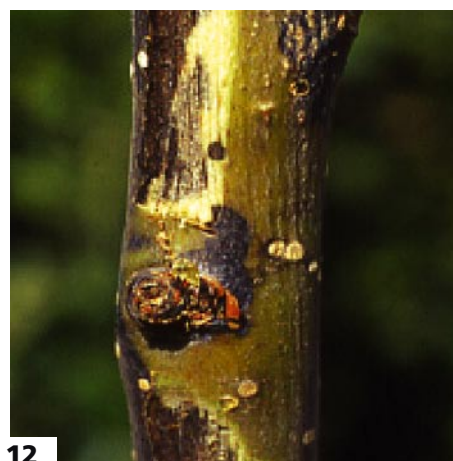
Foto 11 - Infezione su giovane germoglio di pero causata da Pseudomonas syringae . Con l'innalzarsi delle temperature il processo infettivo si arresta ed è possibile notare la tipica «strozzatura» del germoglio. Foto 12 - Astone di pero mostrante imbrunimenti del giovane legno indotti da Pseudomonas syringae

E. amylovora , induce, al contrario, un avvizzimento più cospicuo del ramo. P. syringae , infine, può causare anche delle maculature necrotiche fogliari circondate, solitamente, da un alone clorotico. Non si rilevano, solitamente, sintomi a carico dei frutti. Il batterio può colpire anche gli astoni. Su questi, similmente al melo, si osservano delle leggere increspature dell'epidermide ed estesi imbrunimenti (foto 12). La pianta, quindi, non germoglia affatto o, dopo un inizio di accrescimento vegetativo più o meno regolare, avvizzisce completamente.