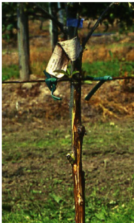
Foto 1 - Astone di melo colpito da Pseudomonas syringae . Sono evidenti gli estesi imbrunimenti al disotto dell'epidermide

■ Astoni e piante di 2-3 anni. L'epidermide del tronco appare leggermente increspata. Asportandola longitudinalmente si mettono in evidenza estesi imbrunimenti del giovane legno (foto 1) che possono interessare gran parte della lunghezza del tronco. Solitamente l'infezione si arresta al punto d'innesto e non si rilevano danni all'apparato radicale. Non si osservano danni a carico di foglie e fiori. Le piante che manifestano questa sintomatologia, solitamente, muoiono nel giro di poche settimane. In questi casi, molto probabilmente, l'infezione è avvenuta mediante l'innesto attraverso l'utilizzazione di gemme infette in modo latente. Il batterio, infatti, può risiedere come epifita anche sulle gemme in via di formazione. Quando queste vengo-