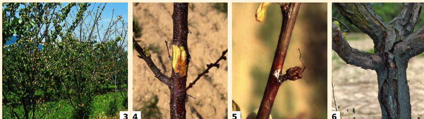
Foto 3 - Avvizzimento primaverile di branche di albicocco. È questo uno dei sintomi più evidenti del deperimento causato da Pseudomonas syringae . Foto 4 - Imbrunimento del giovane legno di albicocco deperiente. Foto 5 - Nelle infezioni causate da Pseudomonas syringae , la gemma a fiore avvizzisce prima della sua apertura. La monilia , al contrario, colpisce i fiori già aperti. Foto 6 - Cancro e fessurazioni longitudinali indotti su tronco di albicocco da Pseudomonas syringae

no prelevate attraverso le operazioni di innesto, il batterio può successivamente colonizzare il giovane germoglio che costituirà l'asse principale del futuro astone. Quando viene messo a dimora e in presenza di fattori predisponenti la malattia (terreni molto sciolti o molto pesanti, inverni freddi, primavere piovose, gelate primaverili)