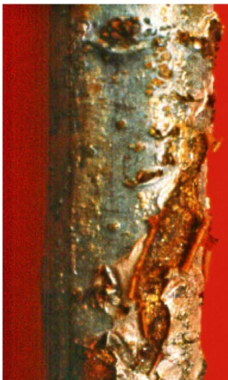
Foto 2 - Tipica «sfogliatura» indotta da Pseudomonas syringae su branca di melo. In questo caso, i primi strati dell'epidermide risultano sollevati