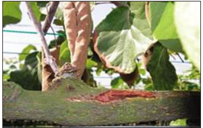
1b . Esteso arrossamento dei tessuti sottocorticali presenti lungo il cordone di kiwi giallo provocato da Pseudomonas syringae pv. actinidiae in piena estate.

ze di quattro geni del cromosoma batterico, gapA , gltA , gyrB e rpoD , ha, similmente, messo in evidenza una notevole similarità tra tutti i ceppi. Infatti, il numero delle basi che variano tra i diversi ceppi di P. s. pv. actinidiae è risultato molto basso. Inoltre, l'indice di "linkage disequilibrium" ha indicato una clonalità statisticamente significativa nei vari ceppi del patogeno ottenuti dalle recenti epidemie di "cancro batterico" in Italia (Ferrante e Scortichini, 2010; Marcelletti e Scortichini, 2011). È interessante sottolineare che i ceppi di P. s. pv. actinidiae isolati nel Lazio nel 1992 sono risultati appartenere ad una diversa popolazione del batterio. Questi studi consentono di affermare che, verosimilmente, c'è stata una singola o poche introduzioni del batterio attraverso materiale di propagazione infetto latentemente. Successivamente il batterio si è ulteriormente diffuso nel territorio nazionale sempre mediante materiale infetto. Tuttavia, la possibilità che i ceppi già presenti nel 1992 possono aver mutato, acquisendo la capacità di infettare il kiwi giallo, non può essere scartata del tutto, viste le pre-