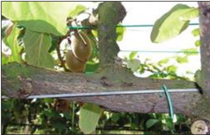
1a - Inizio di formazione di cancro lungo il cordone di kiwi giallo causato da Pseudomonas syringae pv. actinidiae in piena estate.