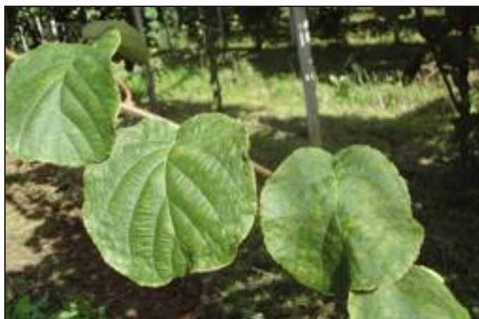
4 - Sintomi iniziali su foglie indotti da Pseudomonas syringae pv. actinidiae su kiwi verde.

teri fitopatogeni. Inoltre, prove sperimentali di campo volte a verificare l'efficacia di vari prodotti nei confronti del batterio, effettuate in provincia di Latina, hanno evidenziato il marcato effetto fitotossico (necrosi ed estese clorosi) che i sali di rame, quando somministrati con cadenza bi-settimanale, inducono sul kiwi giallo già ad inizio estate ( foto 2 ). In molti casi la pezzatura dei frutti viene ridotta del 10-20%. Anche uno sguardo alle normative vigenti che regolano l'utilizzo dei presidi rameici in agricoltura lascia intravedere possibili restrizioni nell'uso del rame come agrofarmaco in prossimo futuro. Si