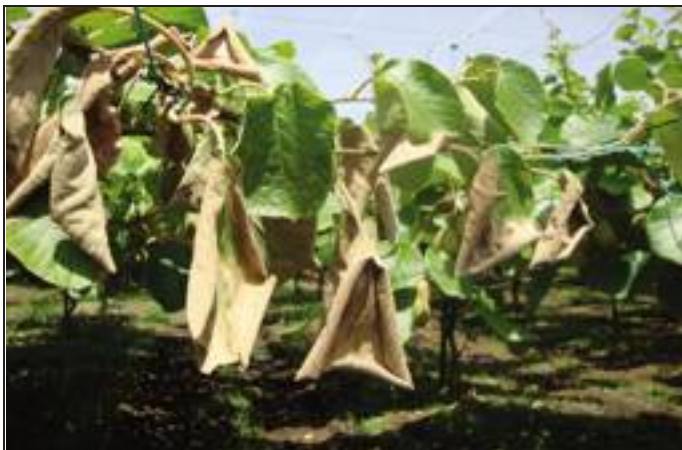
3 - Avvizzimenti primaverili causati da Pseudomonas syringae pv. actinidiae su apparato fogliare di kiwi giallo.

zione va, conseguentemente, contrastata in maniera adeguata, almeno fino a quando la presenza di inoculo batterico non venga drasticamente ridotta. È chiaro che nella fase di riduzione dell'inoculo dovranno essere effettuati molti trattamenti lungo l'arco dell'anno. Una serie di considerazioni ci hanno indotto a non utilizzare i prodotti rameici, almeno nella stagione primaverile-estiva, e a prendere in esame alcuni prodotti fertilizzanti e/o biostimolanti o composti filmanti-traspiranti con marcata attività battericida collaterale. Infatti, esperienze sul controllo del "cancro batterico" dell' actinidia effettuate nel passato in Giappone, dove il batterio ha causato notevoli danni e ha portato alla scomparsa della coltura in molte zone del Paese, hanno messo in evidenza che, dopo alcuni anni dalla ripetuta somministrazione di presidi rameici, P. s. pv. actinidiae acquisisce resistenza genetica verso tale metallo pesante (Goto et al. , 1991; 1994). In presenza di ceppi resistenti al rame il controllo della malattia attraverso tali presidi diventa nullo. Inoltre, la resistenza al rame può essere trasmessa anche ad altri bat-