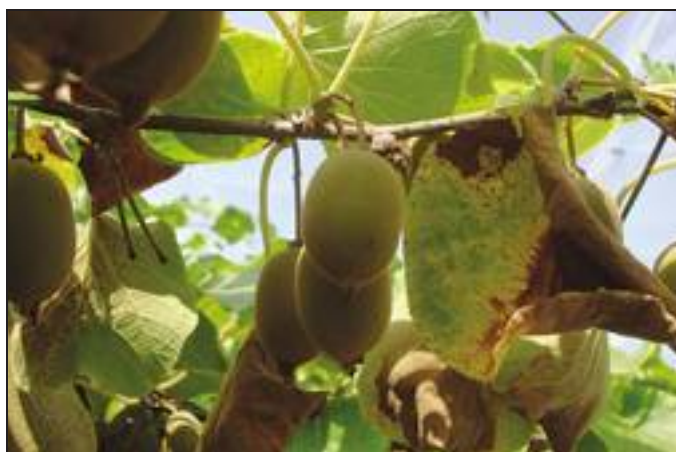
2 . Fitotossicità. Due casi su foglie di kiwi giallo osservati a fine primavera ed indotti dopo pochi trattamenti con prodotti rameici.